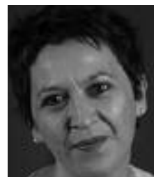
habitants de Drancy, lors du vote au Sénat.

Cette bataille n'est pas finie. Avec Eliane Assassi, Sénatrice de la Seine-Saint-Denis, nous avons porté les pétitions signées par les habitants de Drancy, lors du vote au Sénat.